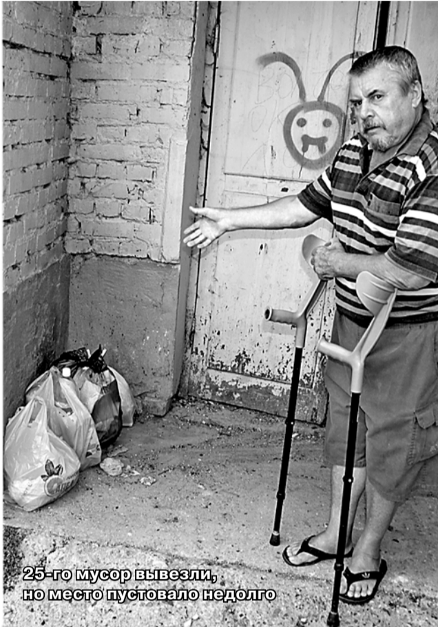
25-го мусор вывезли, но место пустовало недолго