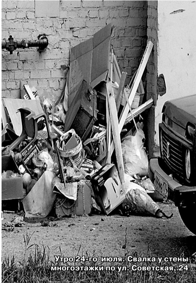
Утро 24-го июля. Свалка у стены многоэтажки по ул. Советская, 24

Жители устроили стихийную свалку прямо у своего дома