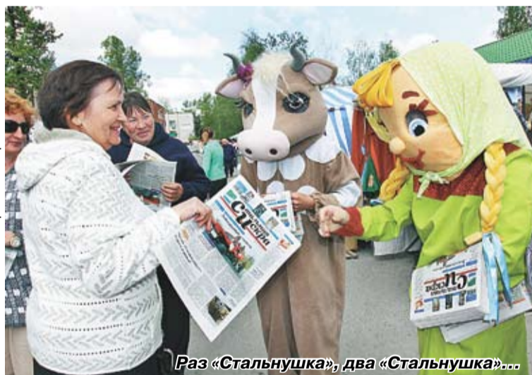
Раз «Стальнушка», два «Стальнушка»...