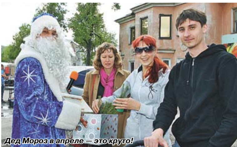
Дед Мороз в апреле — это круто!

Так что читай «Стальную искру» — сажай деревья!