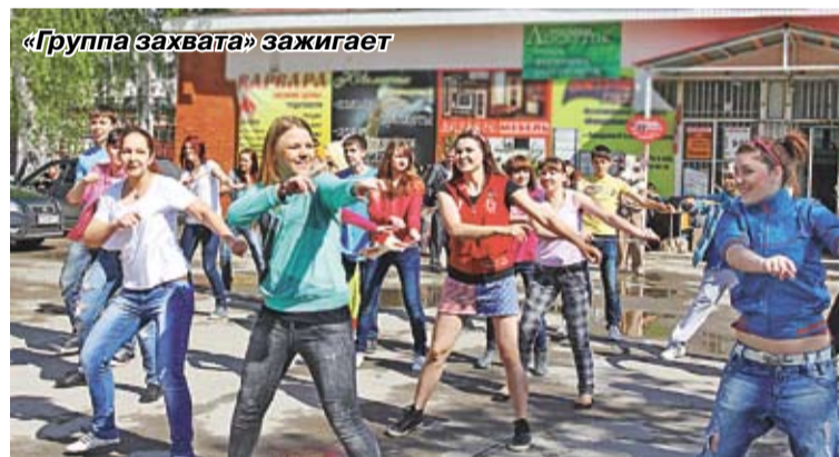
«Группа захвата» зажигает