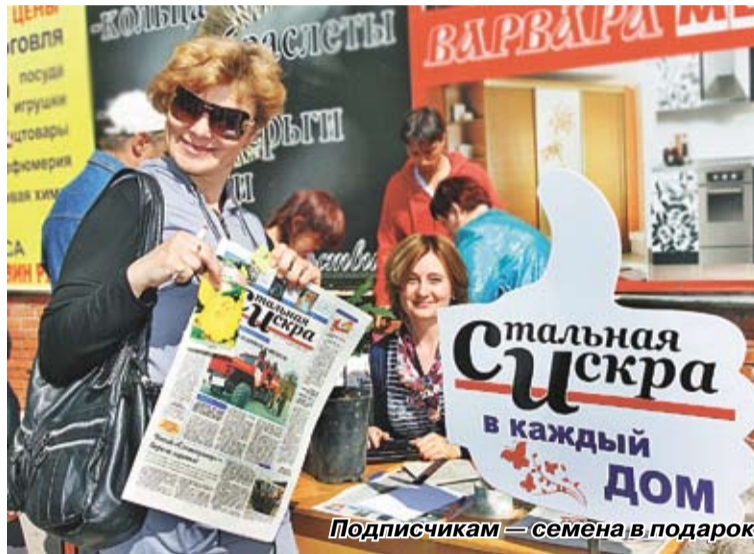
Подписчикам — семена в подарок