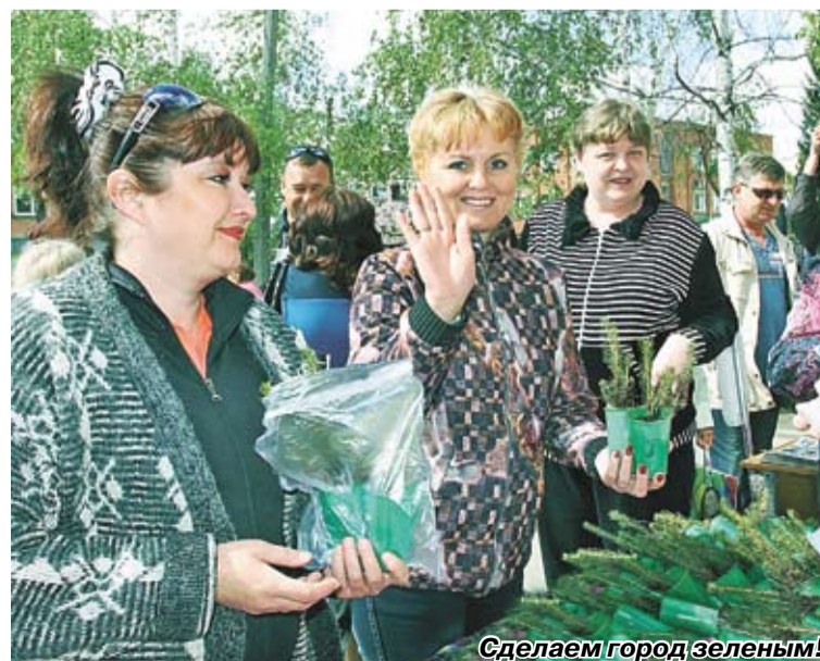
Сделаем город зеленым!