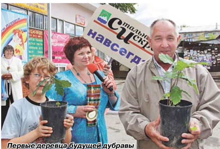
Первые деревца будущей дубравы