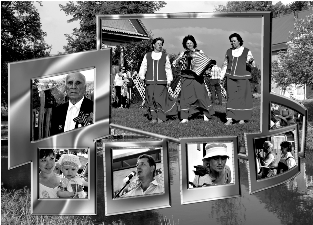
Коллаж Сергея Власова