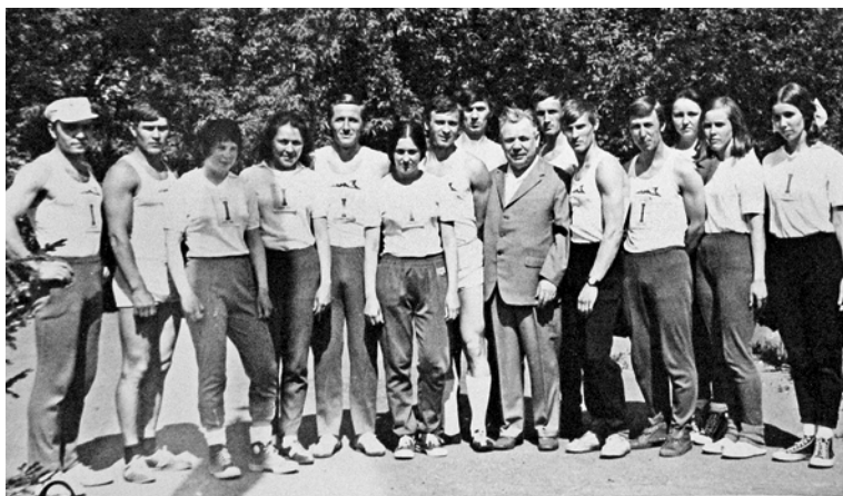
С участниками легкоатлетической эстафеты

ректор Дворца, что пишет эти строки человеку, любящему русскую песню всей душой. Об этом он узнает чуть позже.