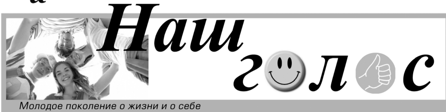
Молодое поколение о жизни и о себе