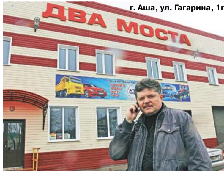
г. Аша, ул. Гагарина, 1г

— Впервые я сел за руль автомобиля в 19 лет. «Жигули»-копейка, автомобиль моего друга. Лет через десять я приобрел свой собственный, долгожданный ВАЗ-2103. Я знал его досконально. Мог посреди дороги до винтика разобрать и собрать заново. В советские времена я возил с собой полный комплект запчастей, шины, вулканизатор. Сейчас этого не делаю. И не только потому, что автомобили стали качественнее. Теперь другое время, другой, высокий уровень автомобильного сервиса, и нет смысла заниматься кустарщиной. Зачем ковырять отверт-