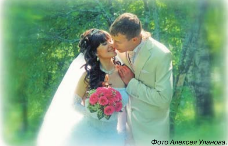
Свадебная и портретная съемка. Тел. 8-904-818-5627

— Муж и жена должны по вере жить, тогда всё сладится. Я это и своим примером могу подтвердить — мы с матушкой в мире и согласии вот уже 52 года живём.