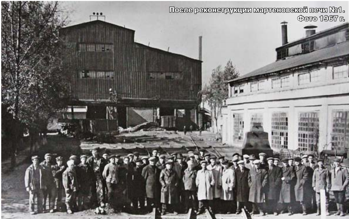
После реконструкции мартеновской печи №1. Фото 1967 г.