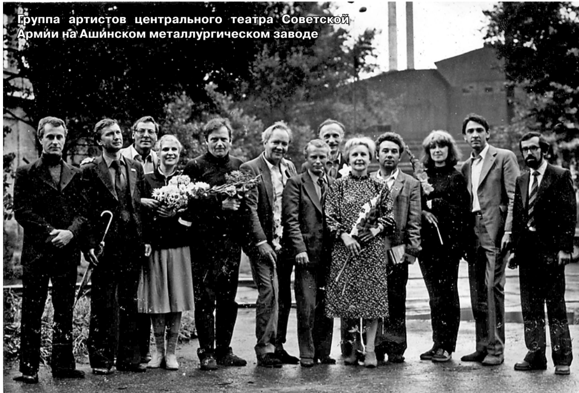
Группа артистов центрального театра Советской Армии на Ашинском металлургическом заводе