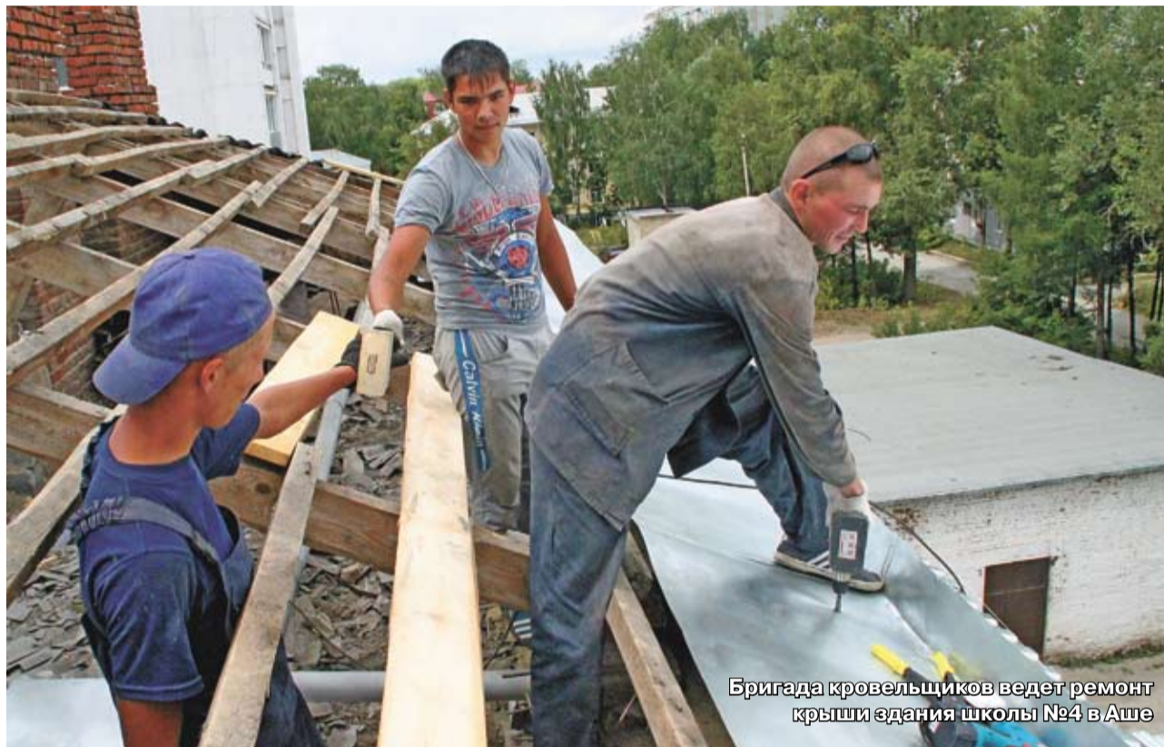
Бригада кровельщиков ведет ремонт крыши здания школы №4 в Аше