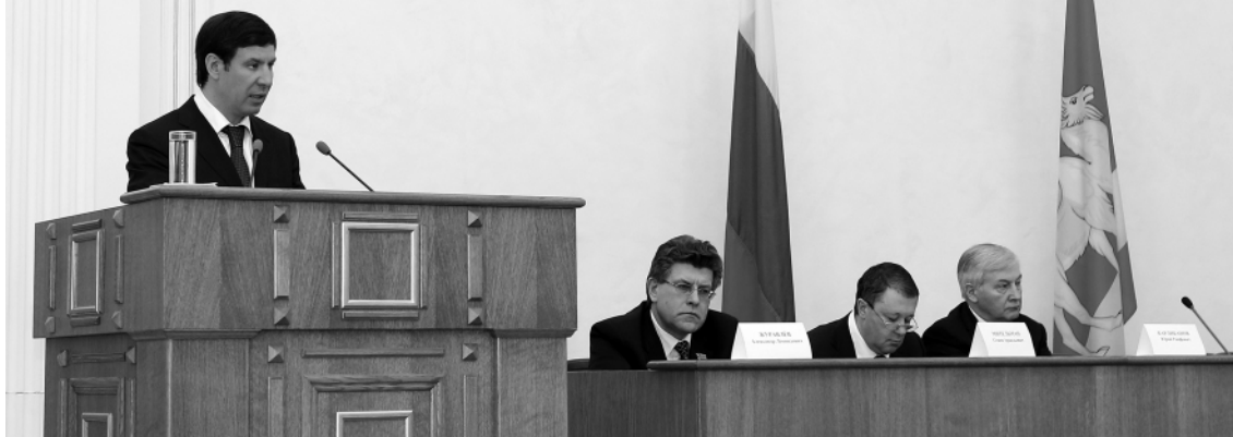
Выступление Губернатора Челябинской области Михаила Юревича перед Законодательным Собранием (отчет о работе регионального правительства за 2010 год и планы на 2011 год)

альных технологий. Опыт показывает, что это эффективнее традиционных форм поддержки.