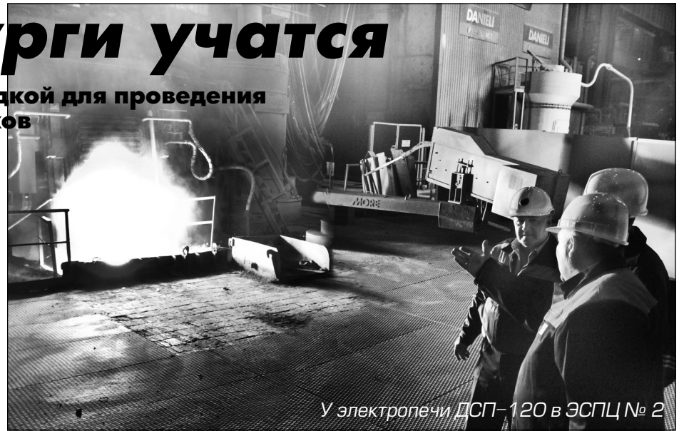
У электропечи ДСП-120 в ЭСПЦ № 2

15–17 июня градообразующее предприятие принимало начальников электросталеплавильных цехов, старших мастеров, инженеров и ведущих специалистов крупнейших металлургических предприятий России и Белоруссии. В программе мероприятия, организованного Корпорацией «Чермет», семинар в Учебном центре и посещение ЭСПЦ №№ 1, 2, КТНП.