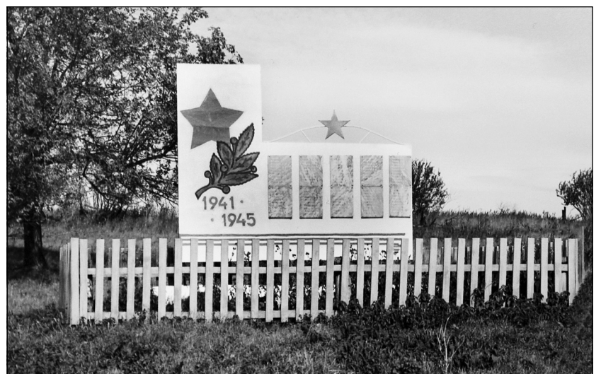
Памятник илекцам, погибшим на фронтах Великой Отечественной войны 1941–1945 г. г.