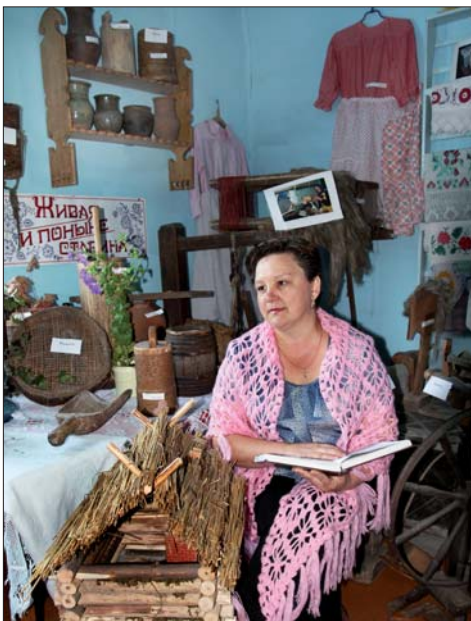
Любимое занятие женщин с. Биянка - вышивка и плетение кружев. Многие могут похвастаться своими работами или изделиями.